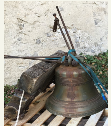
La cloche au pied de la chapelle

Annecy-Le-Vieux Hte Savoie...". Elle venait en remplacement de celle fondue par les Pénitents en 1836, toujours en service dans le clocher de l'église. Dans l'après-midi, la cloche était descendue sur le "Manitou" de Daniel Rolland jusqu'au véhicule des techniciens, pour être emmenée et "soignée" dans leur atelier du Maine et Loire. RV au jour où nous pourrions fêter son retour. B Guillien